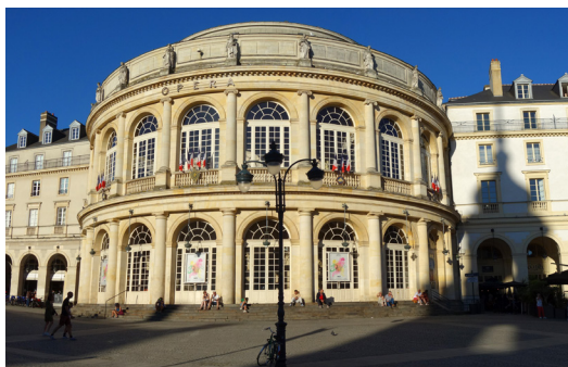
Place de la Mairie, 35000 Rennes